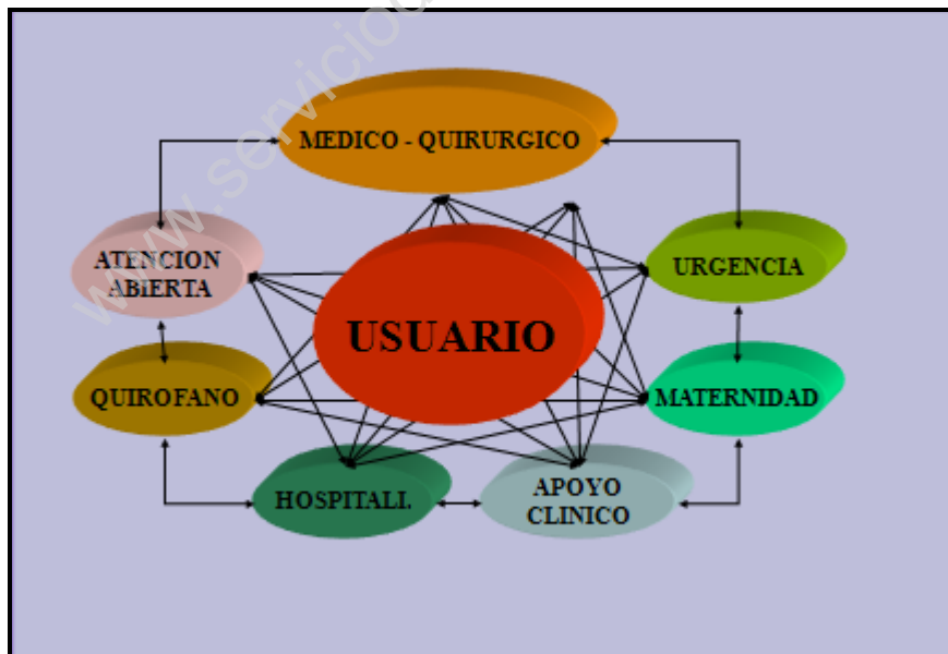
Fig. 1: Procesos Clínicos Claves del Establecimiento.

Todos estos procesos agrupan actividades alrededor de una finalidad común, el Paciente o Usuario , por lo tanto abordando la complejidad de la organización de esta forma, es que se alinean las actividades agrupadas en